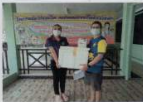
๓๖. ภาพกิจกรรมวันสำคัญทางรัฐพิธีและศาสนา (กิจกรรมวันแม่ กิจกรรมวันพ่อ)